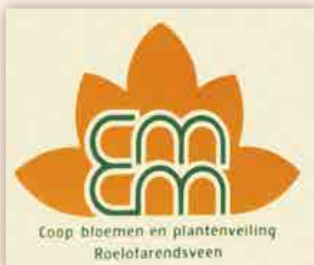
Het eerste logo van de veiling 'Eendracht Maakt Macht'.

spraken onderling af voor welke dagprijzen zij met name de augurken zouden kopen van de tuinders. Bij grote aanvoer moesten de tuinders genoeg nemen met de belachelijke prijs van 5 cent per zak van 25 kilo. De tuinders wisten zelfs vaak niet eens voor welke prijs zij hun producten verkocht hadden. Er werd namelijk verkocht op het gezegde "ik geef net zoveel als een ander", of "ik geef een stuiver meer dan een ander", maar hoeveel die ander gaf werd er niet bij verteld.