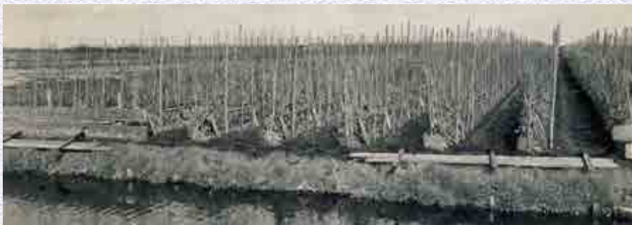
Een Veense akker met bonenstokken met halve raampjes om de teelt te vervroegen. Eind jaren veertig van de vorige eeuw.

Op 1 maart moest iedereen het bos uit zijn en het gekochte hout hebben weggehaald, vanwege de rust voor het wild en omdat in de loop van maart de sapstroom weer op gang komt, waarna niet meer gehakt mag worden. Dan kwam de bosbaas met zijn mensen om eventueel niet verkochte percelen te hakken, omdat anders het uitlopen van de omringende wel gehakte stukken gehinderd werd en omdat het bedrijfstechnisch onhandig is om verspreid door het bos het volgend jaar nog stukjes te moeten verkopen en hakken. Ook werd er ingeboet, dat wil zeggen dat uitgevallen stobben vervangen werden door nieuw stek, om het plantverband in stand