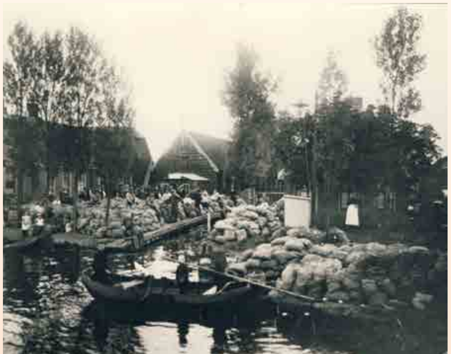
De eerste veiling 21 juli 1902