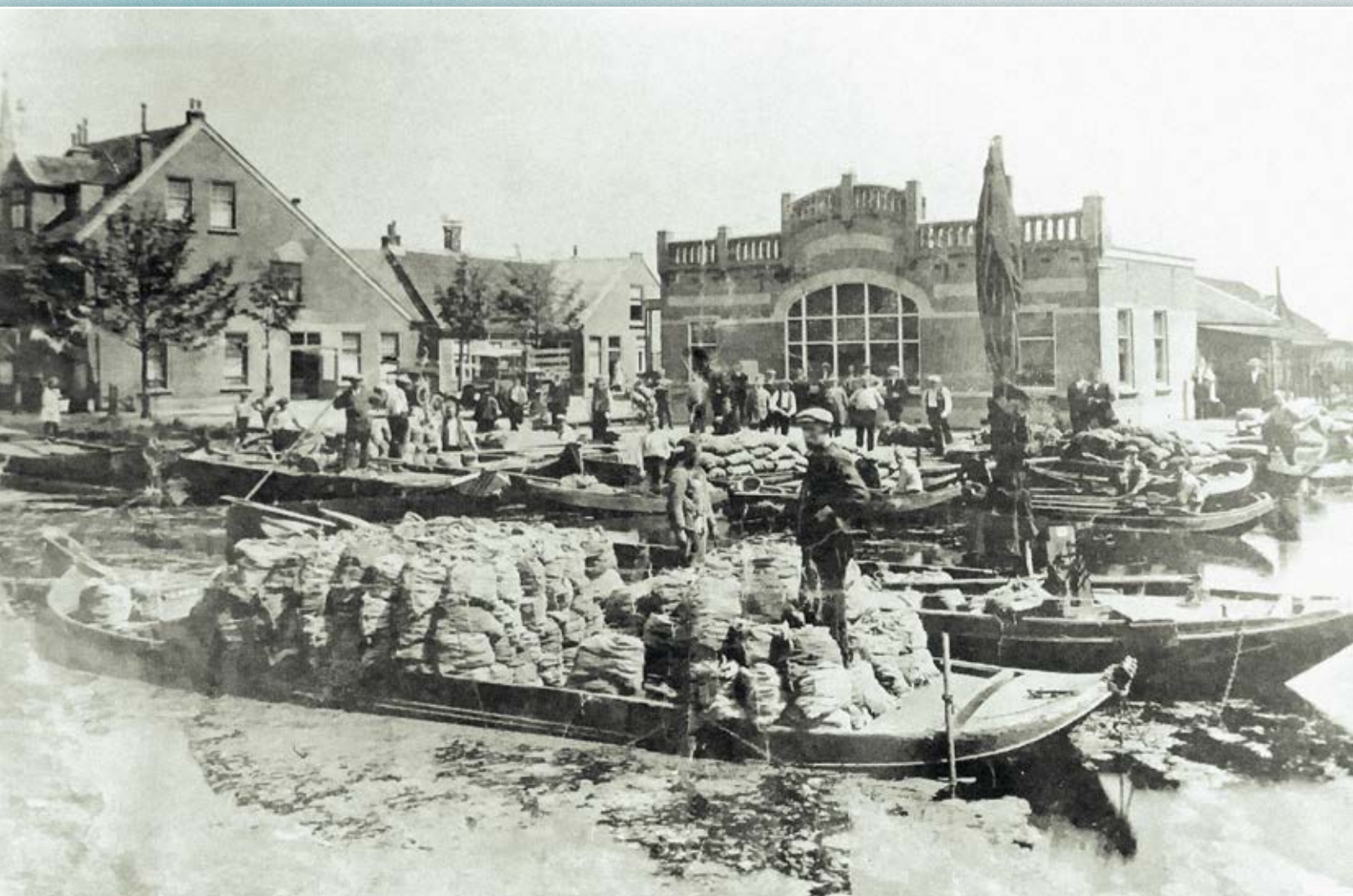
Circa 1920: de aanvoer van groenten bij de veiling 'Eendracht Maakt Macht'.