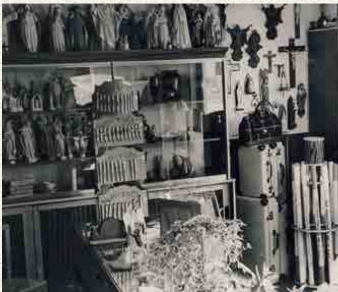
Het interieur van de winkel van Van Harteveld met de vele heiligenbeelden en andere katholieke artikelen.

Een liter melk kostte 16 cent, een pakje boter 21 cent en een ei kostte 15 cent. Eieren waren dus erg duur en die werden er ook maar weinig verkocht, meestal maar één exemplaar voor door de sla. Behalve met Pasen, dan werden er wél veel eieren gekocht door de Veenders. Zóveel zelfs dat er op woensdag voor Pasen geen melk, maar alleen eieren verkocht werden. Ondanks dat ze dan nog duurder waren, werden er in één gezin soms wel meer dan honderd eieren geconsumeerd. Er werd één keer per week betaald en een klant van tussen de zes en acht gulden was een goeie klant. Soms waren er meer melkboeren in een wijk. Men kocht dan de ene dag bij de ene, en de andere dag bij de andere melkboer. Dat was gewoon een kwestie van gunnen. Toen de melk in flessen kwam, namen de melkboeren gewoon de lege flessen van elkaar mee, want alleen de fabriek rekende statiegeld af.